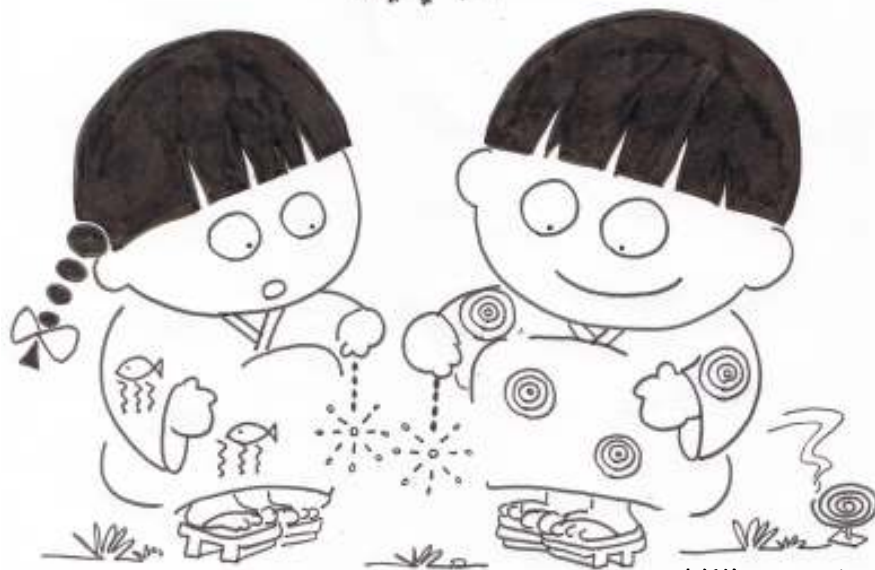
表紙絵：ノースアイランド2号(大和市職員)