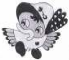
カッコーフェスタのシンボル カッコちゃん