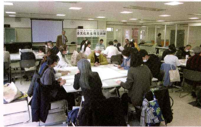
地域、企業、学校、行政などさまざまな立場の人が混在したグループに分かれて実施したワークショップの様子。

普段から地域の生活情報を日本語で得ることがむずかしい外国人市民は、大きな災害が起きた場合、被害の状況や生活支援に関する情報を把握することがさらに困難な状況に陥ります。このような事態に備え、大和市では、大きな災害が起きた際に市と当協会が「災害多言語支援センター」を立ち上げ、外国人市民向けに多言語による情報提供を行う内容の協定を取り交わしています。また、災害時に外国人市民が直面する困難をともに考え、外国人市民を含めた地域住民同士の共同作業を通じて地域の防災力の向上を図る目的で「多文化共生防災訓練」を市国際・男女共同参画課と当協会が共催する形で実施しています。