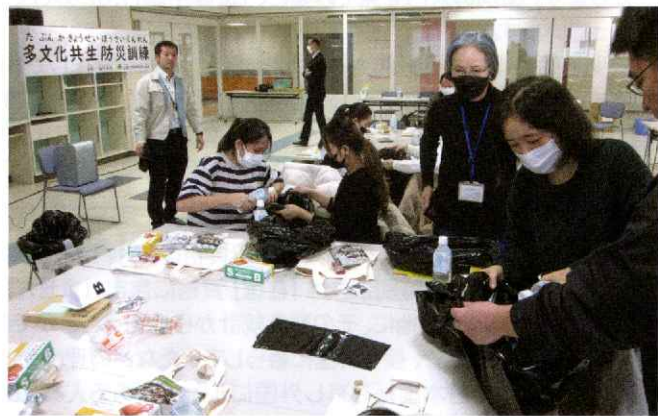
外国人向け訓練(実際に水を使って携帯トイレを体験するなど防災用品の使い方を学びました。)

最後に参加者全員がグループに分かれてやさしい日本語とピクトグラムを使って災害情報を伝える合同のワークショップを行いました。「知らせたい内容は多いが、実際に被災すると何を伝えるべきなのか簡潔でわかりやすいお知らせが必要だとわかった。」「言葉より文化の違いが大きな問題なのかと思った。」などといった意見があり、外国人向けに情報を伝えるときに気をつけることが理解できたようでした。また災害時に母国へどのように連絡したらよいか、心配になったという外国人の声も挙がっていました。