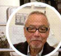
興津副センター長

これからの5年間、指定管理者としてこれまでUMECOが培ってきたノウハウや人とのつながりを活かし、地域や企業、学校等のお力をいただきながら、市民活動団体に対し、更なる支援を図ってまいります。