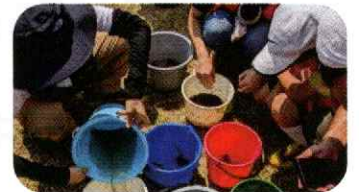
写真は2023年度の体験学習の様子です