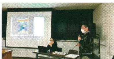
鎌倉ガーディアンズ

また、現地へ行って活動せずとも募金や観光支援も大切な被災地支援です。最近ではクラウドファンディングも始まっています。災害直後だけではなく、息の長い支援を続けていきたいものです。