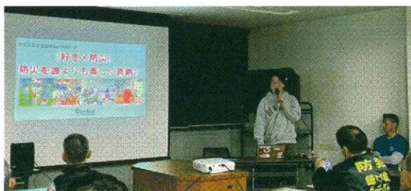
防災普及学生団体 Genkai