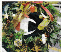
クリスマスリース作り