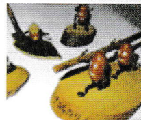
だんごを使ったおもちゃ作り

他にも、紙芝居や県の取組紹介などがあるので、そこで勉強し、クイズにチャレンジして景品をゲットしよう!