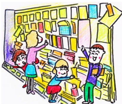
2007年8月、館外掲示板を設置

館内の掲示板は、設立当初はボードのみで、ピンでチラシを留めていました。翌年にボード下部に設置するラックを購入し、2008年頃、ボードにクリアケースを留め、そこにチラシを入れる方法を当時のスタッフが考案し、現在のスタイルが出来上がりました。昨年度1年間では、大和市民活動センターに約500件630種類のチラシ等が届き、展示しました。もっと多くの方の目に触れてほしいというのがスタッフの願いです。