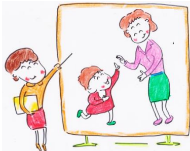
親と子のタッチ研究会