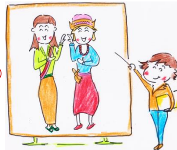
やまと国際フレンドクラブ(IFC)

企画書提出・協議・申請期間を経て市民活動推進補助金プログラムに応募した下記2団体が、公開プレゼンテーションを行ないます。