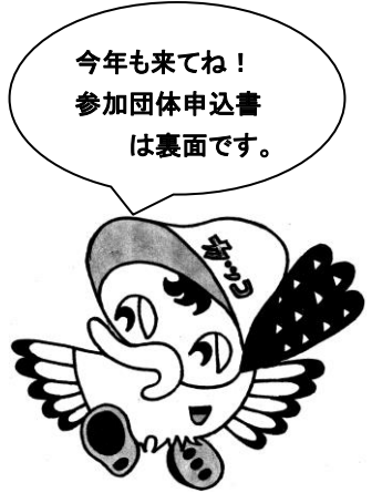
カッコーフェスタキャラクター カッコちゃん