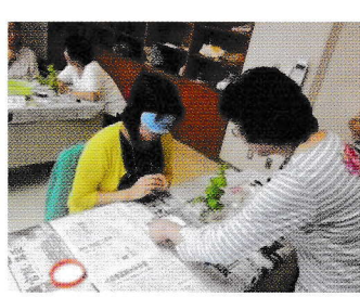
第6回ロールプレイ