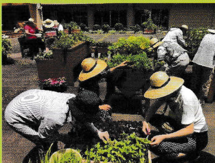
園芸療法活動の様子

植物は人の心を癒し、穏やかにし、和ませる力があり、 園芸作業は人の心や身体を前向きに能動的にする力があります。 植物や園芸作業を活用するリハビリテーションとしての“園芸療法”。 その考え方や手法を取り入れて、自分の中に種をまき、 地域の中でボランティアとして活躍しませんか？