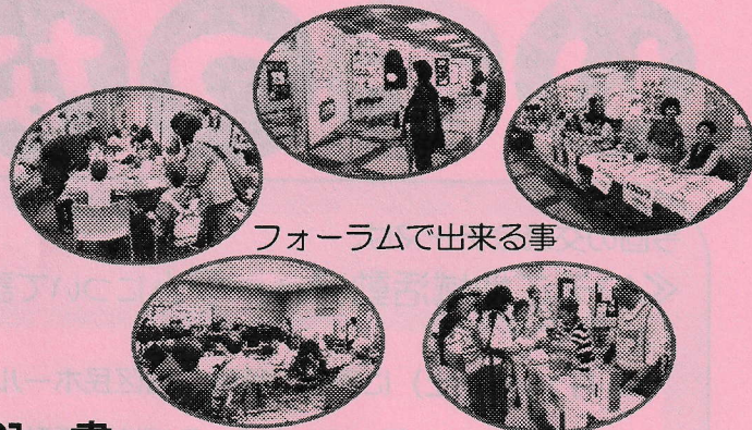
フォーラムで出来る事

いそご地域活動フォーラムは、登録されているグループ・団体、地域ボランティア講師の方々の活動発表の場として、また様々なつながりの場として年に1回行っています。