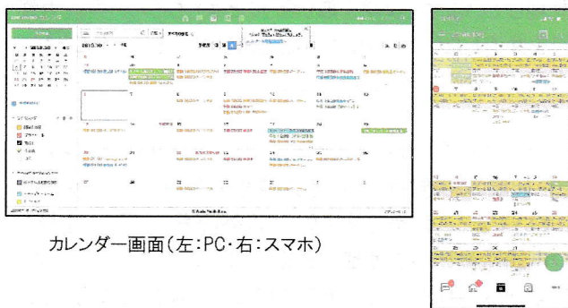
カレンダー画面(左:PC・右:スマホ)

準備から当日までの予定はカレンダーで誰もが見えるようにしておき、当日撮った写真はそれぞれがその場で共有します。日頃の会議等でも非常に活用できます。話したい話題を事前にアンケートで集め、議事録等は掲示板に張っておきましょう。あとからでも簡単に確認できることで報告書を書くときにも便利になります。