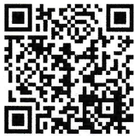
紹介動画を見ることができます