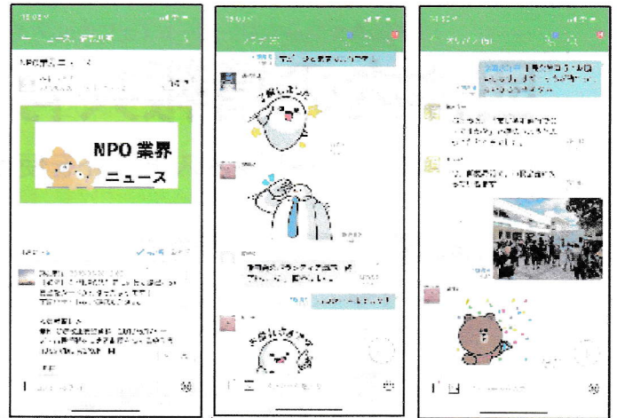
掲示板(左)、トーク(中央・右)の画面

まずは11月23日(土)には「LINE WORKS体験セミナー」を実施しますので、ご興味のある方はぜひご参加ください。日頃の活動だけでなく、「今度イベントを行うので使ってみよう」という方も大歓迎です。お気軽に体験をしてみてください。