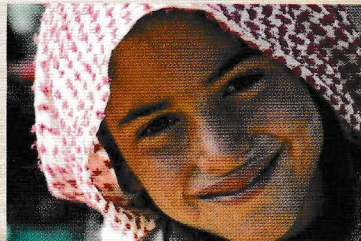
写真「シリアの遊牧民」