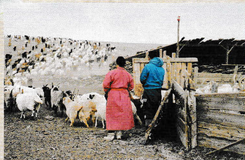
写真「モンゴルの遊牧民」