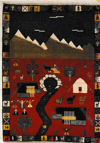
イランの絨毯「ギャッベ」 所蔵:ギャッベハネ (株式会社MRBトレーディング)