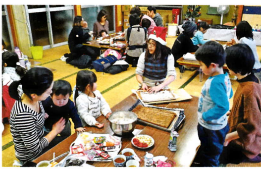
子ども食堂のクリスマス会の様子