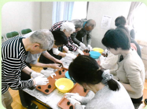
大和市主催の無料園芸講座