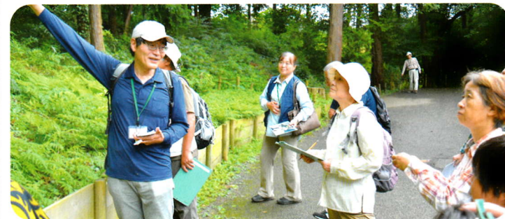
企画・運営 しらかしのいえボランティア協議会 泉の森ガイド部会