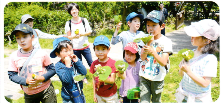
企画・運営 しらかしのいえボランティア協議会 自然あそび部会

対象(定員) 参加料 持ち物 申し込み方法 講師 当日 当日受付(現地先着順) 託児あり 対象:2歳~未就学児(9人)(教室と同時申し込み/1人につき1名まで)