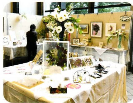
展示団体:千花の会 押花倶楽部