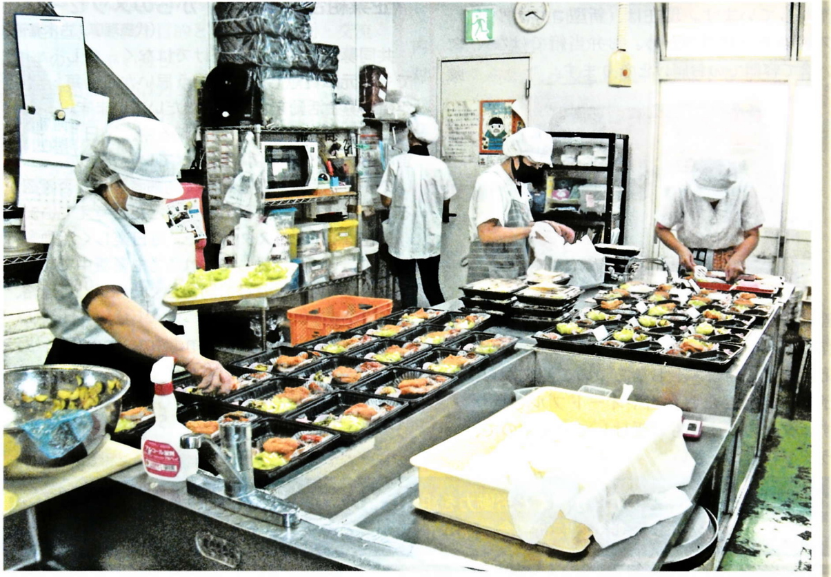
まごころ込めたお弁当作り