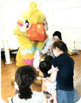
ワックルから子どもたちへお菓子とおもちゃのプレゼント

ワックルは、「これからも地域の皆さんのためにできることを続けていきたい」と言ってくれました。