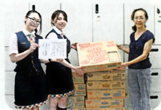
たくさんのカップ麺の寄附