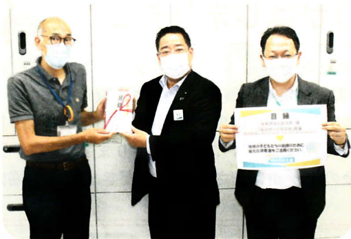
大和営業所から子ども食堂へ寄附金をいただきました