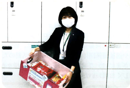
大和北営業所から“もったいないからありがとうへ”に食料品をいただきました

明治安田生命保険相互会社は、営業所単位で、従業員の募金に会社が寄附を加えて「私の地域応援募金」を実施しています。