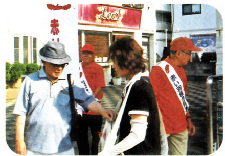
～南林間地区社協 街頭募金の様子～

問合せ：神奈川県共同募金会大和市支会 (大和市社会福祉協議会 総務課) TEL：046-260-5633