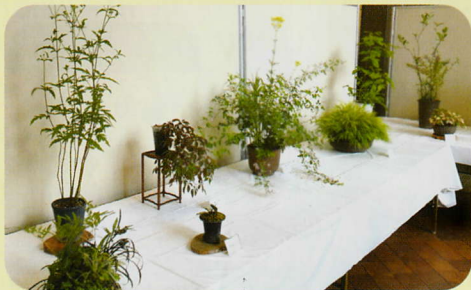
展示団体 大和山草の会