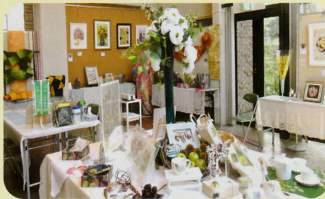
展示団体 千花の会押花倶楽部