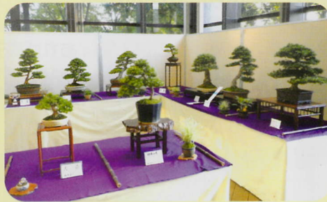
展示団体 大和盆栽さつき愛好会