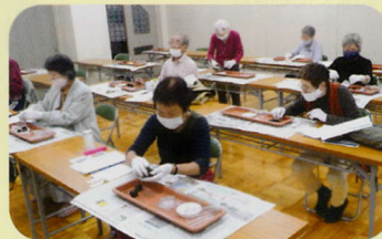
大和市主催の無料園芸講座