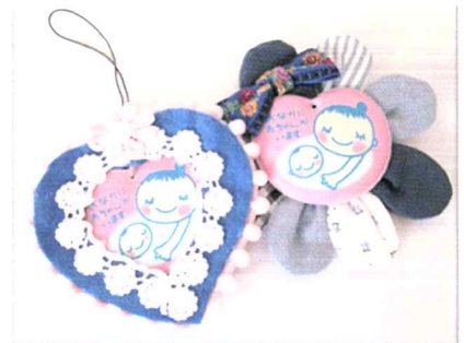
ハンドメイドのマタニティマークをプレゼント

市外にお住まいの方、里帰りしている方、おじいちゃん・おばあちゃんなどの参加はご相談ください。