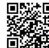
説明会申込 フォーム

本プログラムへの参加にあたって応募説明会への出席は必須ではありませんが、本募集要項の趣旨や対象要件などをご確認のうえご応募ください。