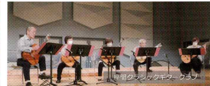
座間クラシックギタークラブ