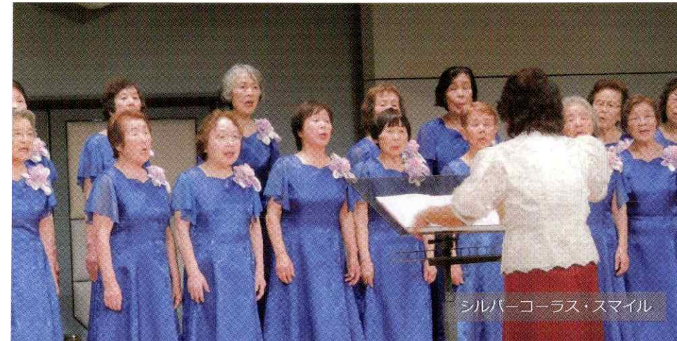
シルバーコーラス・スマイル