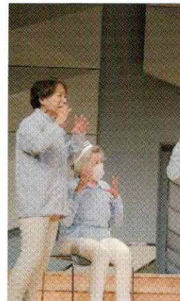
要約筆記と手話 ひまわり会