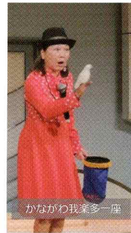
かながわ我輩多一座