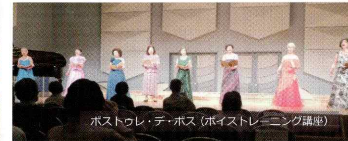
ボストウレ・デ・ボス（ボイストレーニング講座）