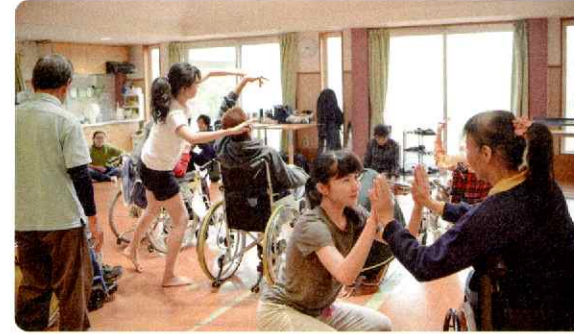
重度重複障がいのある人とのダンスの取組み

障がいのある人が芸術文化活動に触れる機会はまだまだ足りていないと考えています。ワークショップを通して、障がいのある人の日々を支える支援者のみなさんや芸術家といっしょに、障がい福祉と芸術文化のよりよいかかわり方を探究しています。