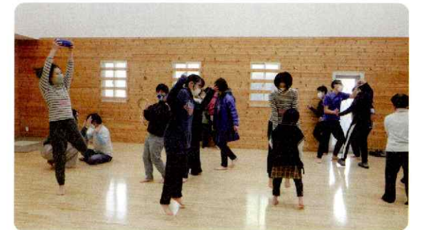
知的障がいのある人とのダンスの取組み