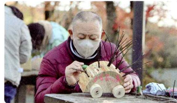
精神障がいのある人との美術の取組み