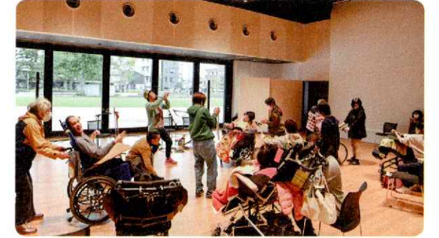
重度重複障がいのある人との音楽の取組み