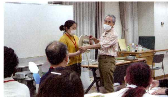
展示をテーマにした講座

障がい福祉、芸術文化、教育など多分野からゲストを招き、分野をまたいだ知見を深める内容の講座を開催しています。