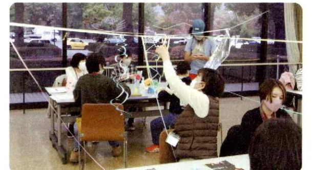
造形ワークショップを体験する講座