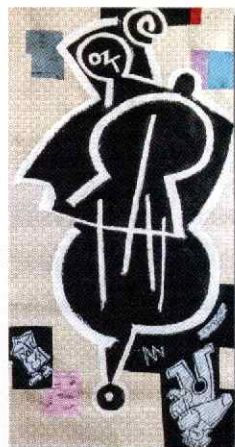
virtual city BCN「チェロ」 和紙に墨・コラージュ・オイルスティック

カラフルで心地よい時空間を 描いた絵画は国内外で高い評価を 得ている。 ギャラリーおがわ(桜ヶ丘)は、 1991年の創業時より作品取り扱 い、個展などを開催。2020年に 常設展示館を開設した。