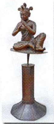
昭光流音 (音声菩薩)