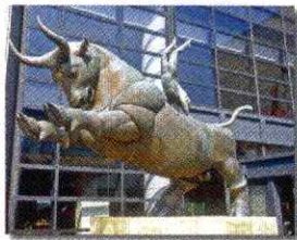
牛跳び 【大和スポーツセンター】