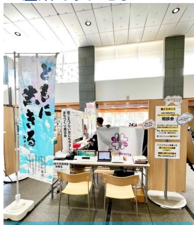
11月に茅ヶ崎市役所ロビーにて相談会を開催

自分の中にある考えや感情を自分の言葉にして伝えること、それが温かく受け止められること——。こんなあたりまえのことが、困難な時代がありました。そして今でも、それが難しい人たちがいます。